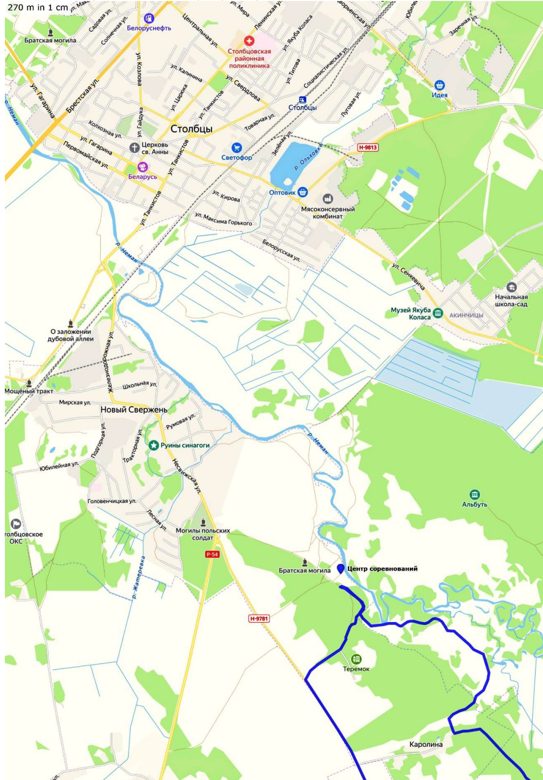
Схема расположения Центра Соревнований:

Координаты центра соревнований на maps.google.com: 53.44101; 26.76171.